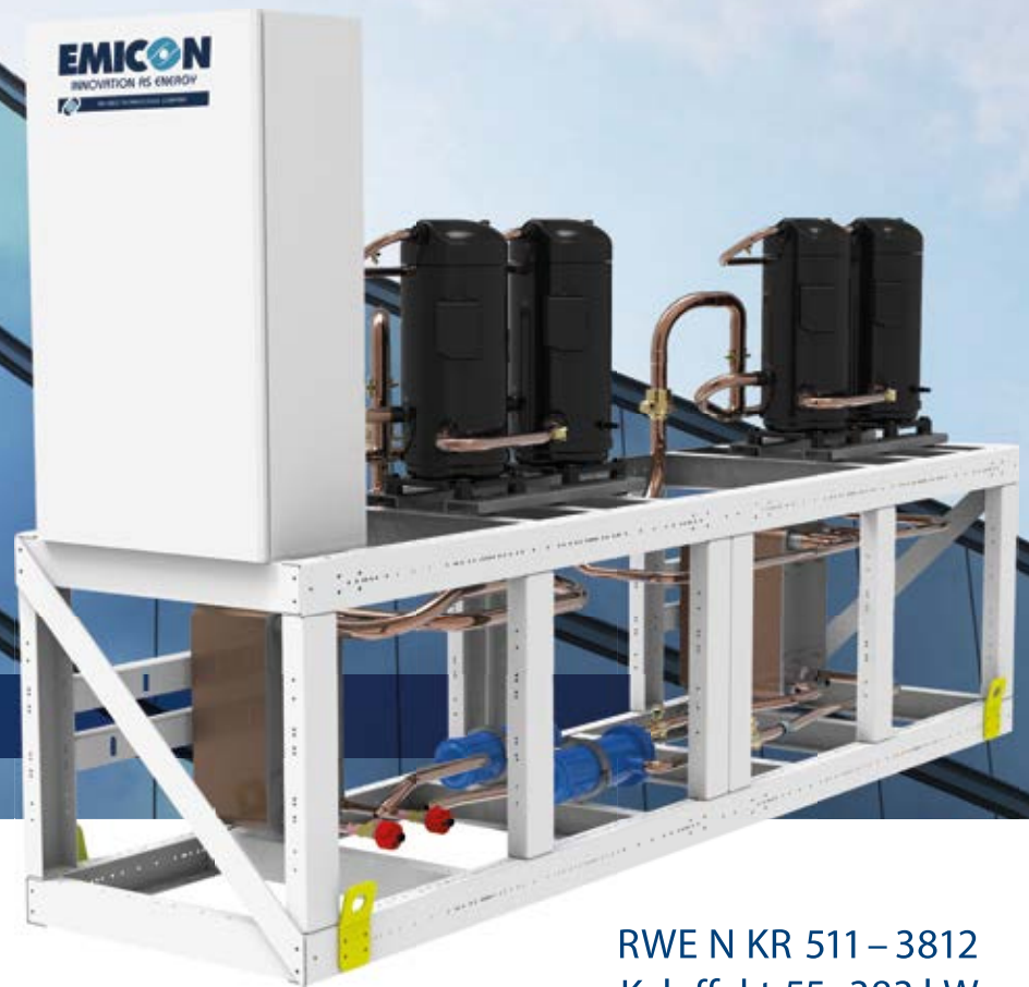
Kylaggregat med R454B