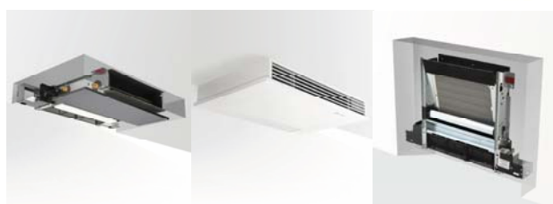
ELFORoom 2 INVOT

PASSAR ALLA INSTALLATIONER - ELFORoom 2 har en av marknadens tunnaste profil på endast 131mm med kabinett och 126mm utan kabinett detta gör ELFORoom 2 väldigt lätt att tex. bygga in, placera under ett fönster eller på en vägg.