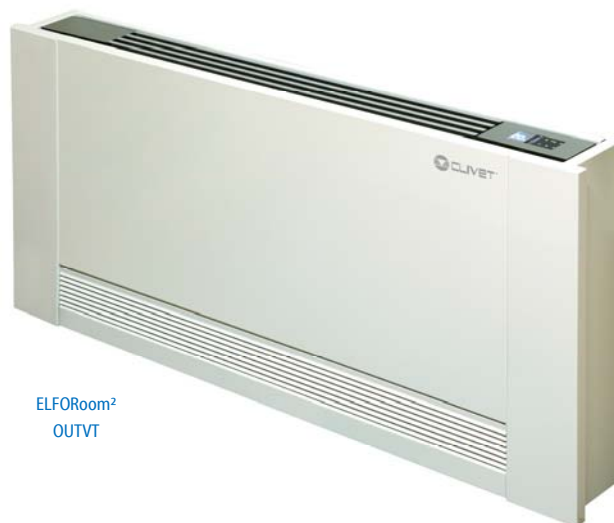
ELFORoom 2 OUTVT